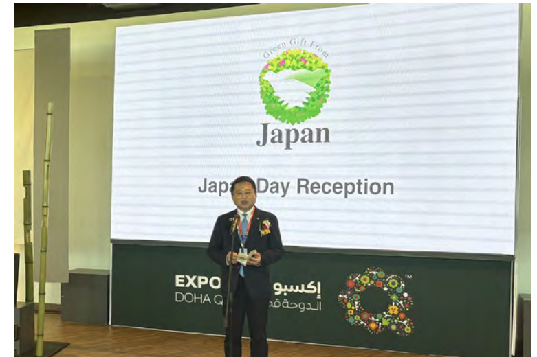
<ジャパンデーレセプションでの挨拶>