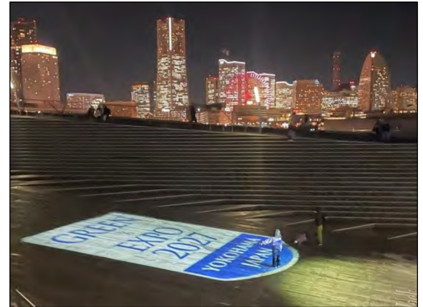
<ヨルノヨでの プロジェクションマッピング>