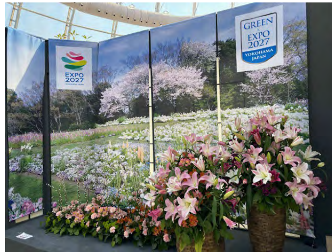
<ドーハ国際園芸博覧会の日本国出展>