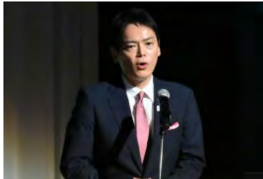
<市長による主催者挨拶>