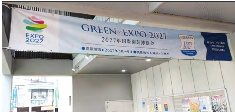
<区役所など公共施設への横断幕掲出>