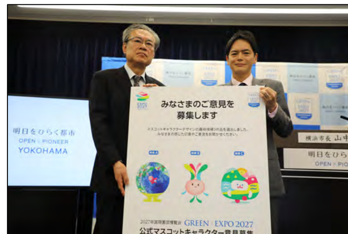
< 記者発表の様子 >