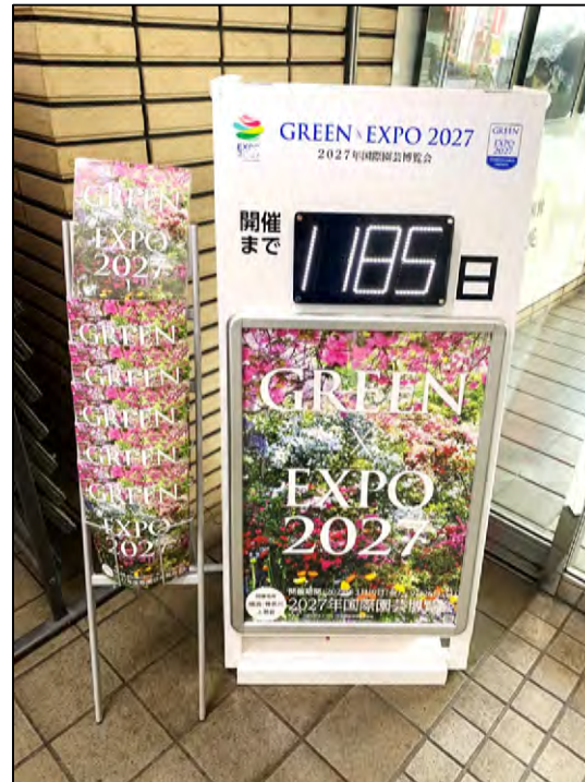
<カウントダウンボードの設置>