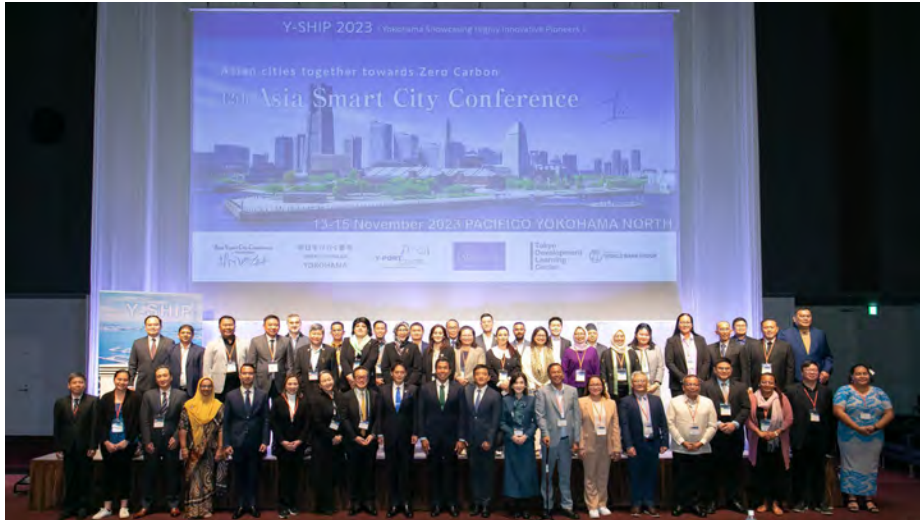
<国際コンベンションY-SHIP>